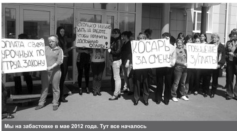
Мы на забастовке в мае 2012 года. Тут все началось

Прежней осталась только работа. А условия и зарплата стали такими, хуже некуда. Индексация зарплат на фабрике обходилась нас стороной; доплаты за ночные, сверхурочные и за вредность исчезли. Вместо постоянной занятости всех перевели на срочные договора, которые безалаберные менеджеры агентства забывали продлевать, так же как и вовремя направлять нас на обследование для продления медкнижек. Куда-то