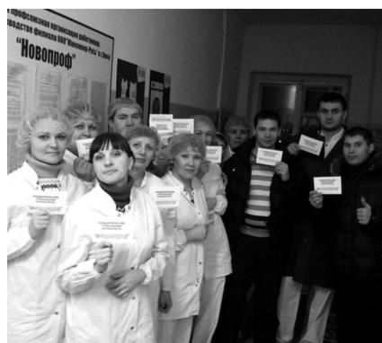
Мы у нашего профсоюзного стенда на фабрике «Инмарко»