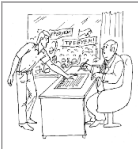
Без общей поддержки нельзя добиться успеха!

После избрания лидеров члены профсоюза должны следить за деятельностью должностных лиц, регулярно проводить проверки, чтобы не допустить халатного отношения к делу и отклонения от проведения политики, выработанной демократическим путем. Программа действий и предполагаемые решения должны быть предварительно представлены на рассмотрение рядовых членов профсоюза. Избранные лидеры должны поощрять членов профсоюза более активно участво-