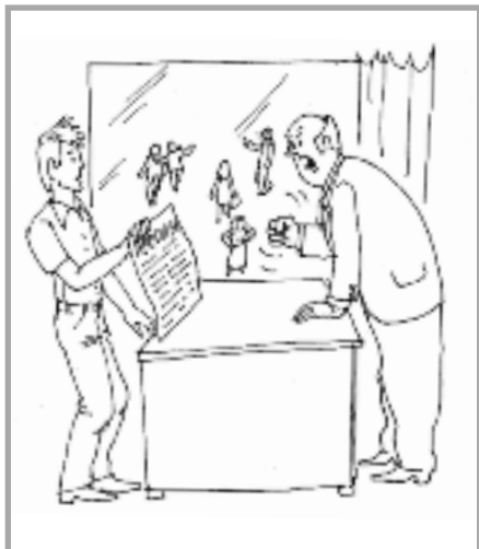
Успех профсоюза зависит от его членов.

Члены профсоюза избирают из своих рядов ответственных и способных людей для исполнения обязанностей должностных лиц. Их главная задача — не решать все проблемы самостоятельно, а организовать и координировать работу организации и ее аппарата! Ни один профсоюзный лидер без активной поддержки своих членов не сможет добиться существенных улучшений условий и оплаты труда работников. Поэтому его/ее задача — организовать эту поддержку.