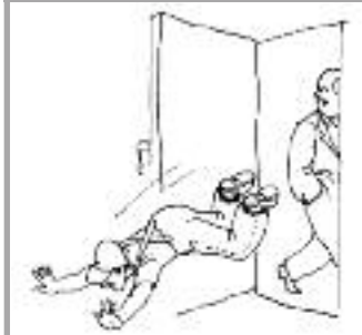
... редко заканчивается положительным результатом.