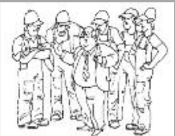
Однако помогая друг другу, обсуждая проблемы и действуя сообща мы добиваемся своего!