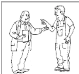
Разговор с работодателем один на один...